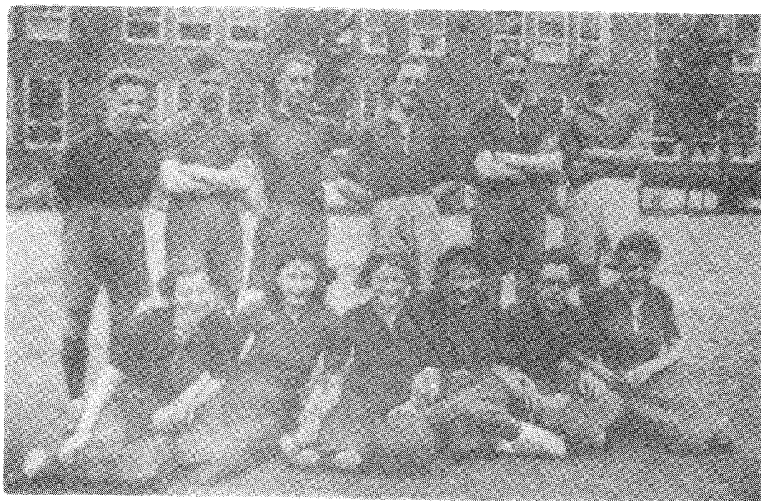
Landlust 2 - kampioen 1939-1940.